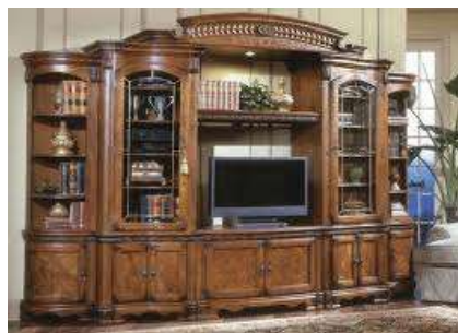
Entertainment center Стінка