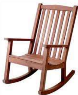
Rocking chair Крісло-качалка