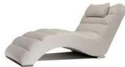
Chaise longue Шезлонг