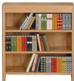
Bookcase Книжкова шафа