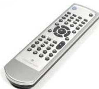
Remote control Дистанційний пульт