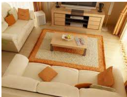
Living room Вітальня