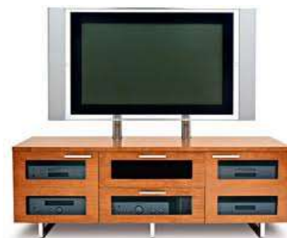
TV stand Тумбочка під телевізор