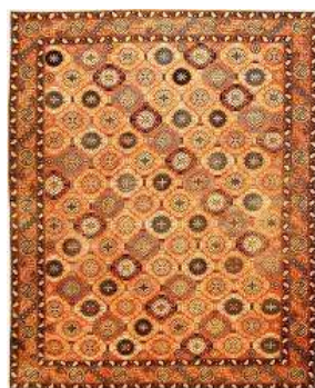
Carpet, rug Килим