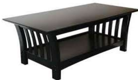
Coffee table Журнальний столик