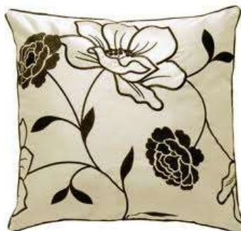
Cushion Декоративна подушка